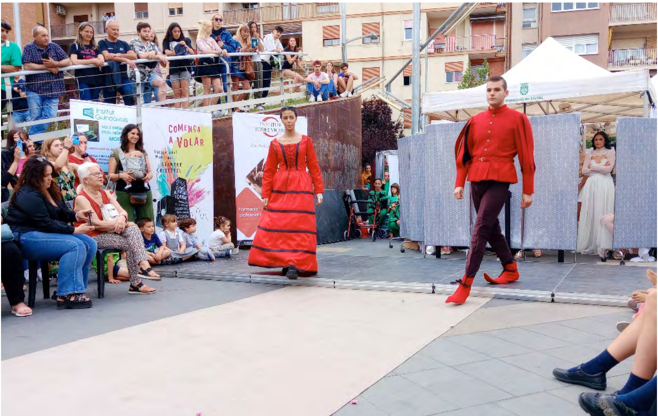
Imagen 3. Desfile de moda del curso 2021-2022, organizado por el INS Guindàvols y el INS Torre Vicens, donde se presentó la indumentaria realizada por el alumnado a partir del retablo gótico de la iglesia de Sant Joan de Lleida