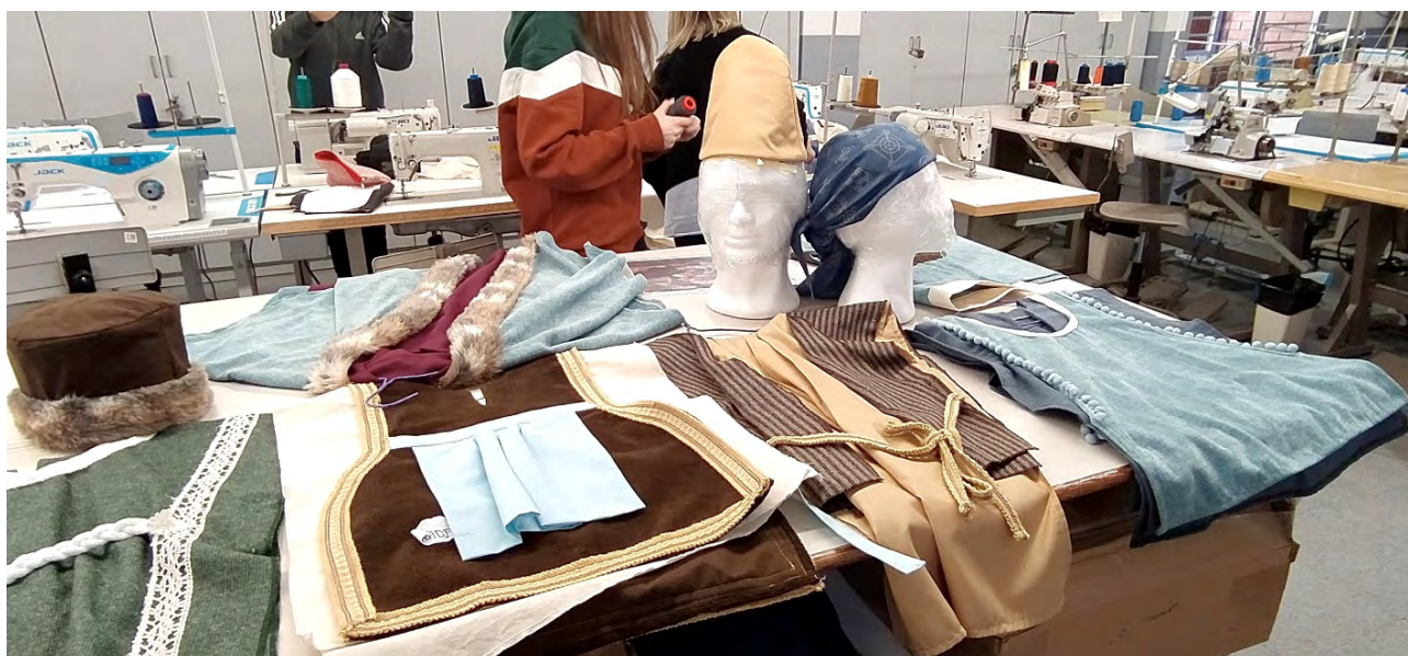
Imagen 1. Proceso de elaboración de indumentaria en el taller de confección del Instituto Guindàvols de Lleida