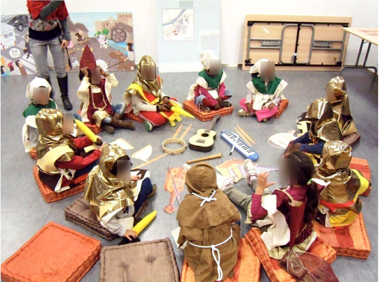
Imagen 4. Alumnado de educación infantil participando en el itinerario Quadrivium . La ciència a l'edat mitjana y ataviado con la indumentaria medieval confeccionada por el alumnado del ciclo formativo del INS Guindàvols