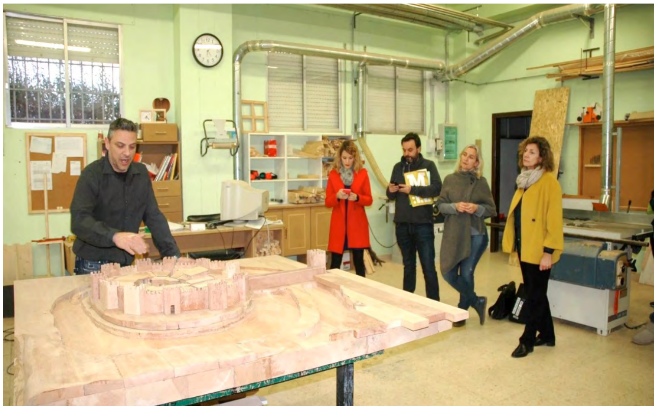
Imagen 5. Explicación del proceso de elaboración de la maqueta en el taller del PFI de carpintería del INS Templers

En relación con el seminario Fem d'arqueòlegs , el alumnado del PFI creó, con el asesoramiento de los arqueólogos que estaban estudiando y excavando el yacimiento ibérico de Vilars de Arbeca, una de las piezas principales de la exposición La Fortalesa dels Vilars D'Arbeca. Terra, Aigua i Poder en el Món Iber: la maqueta de la fortaleza (imagen 5). Esta maqueta supuso, de hecho, una actualización de la maqueta de la fortaleza que expone el museo en su colección permanente, ya que incorporaba los últimos avances de la investigación. 8 Además de esta gran maqueta, los alumnos también realizaron maquetas de menor tamaño de algunas casas prehistóricas construidas con diversas técnicas, pero con un elemento en común: el uso de la madera. Estas pequeñas maquetas se emplean regularmente en los itinerarios educativos de arqueología. Igual que en el caso de la realización de la indumentaria, la construcción de las diversas maquetas comportó todo un proceso de investigación histórica por parte de los alumnos del PFI, además de la aplicación de los procesos propios del trabajo y tratamiento de la madera para su construcción.