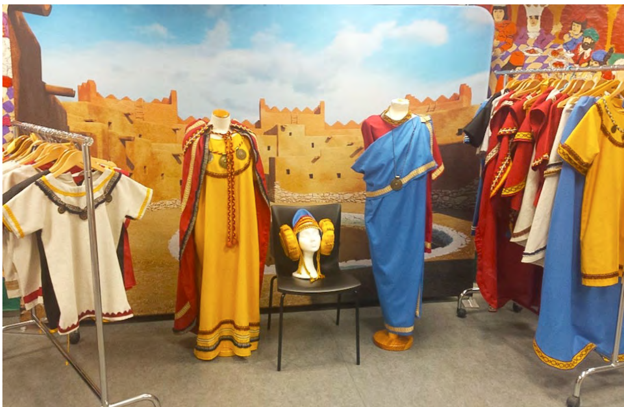
Imagen 2. Presentación de la propuesta didáctica Fem d'arqueòlegs, con la indumentaria de época ibera realizada por los alumnos del ciclo de formación

primaria (imagen 2). En el proyecto también participaron dos programas de formación e inserción del INS Castell dels Templers, concretamente los de carpintería, que se explicará en el siguiente apartado, y el de peluquería y estética, que desarrolló un proyecto sobre la estética en el mundo antiguo que se presentó al público en la Noche de los Museos de aquel año (Telepublic, 2016).