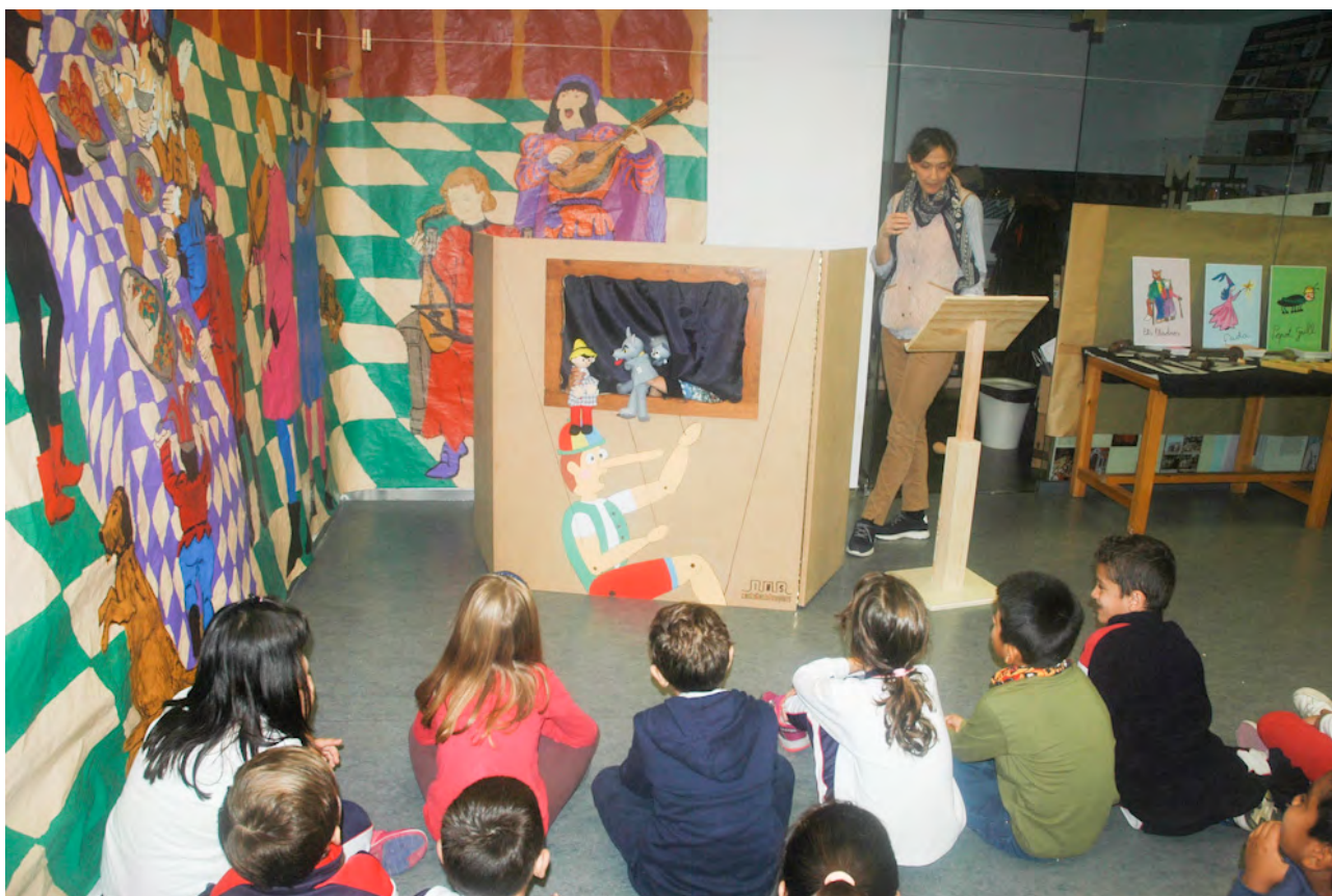
Imagen 7. Realización de la actividad del guiñol con alumnado de educación infantil