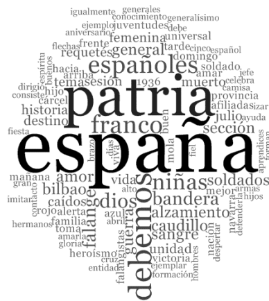
Imagen 3. Nube de palabras de la variable «patria»