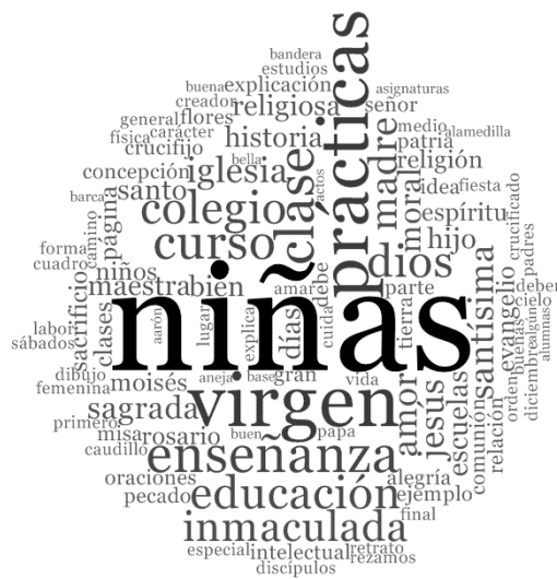
Imagen 2. Nube de palabras de la variable «religión»

Fuente: elaboración propia. A partir de NVivo v.12.