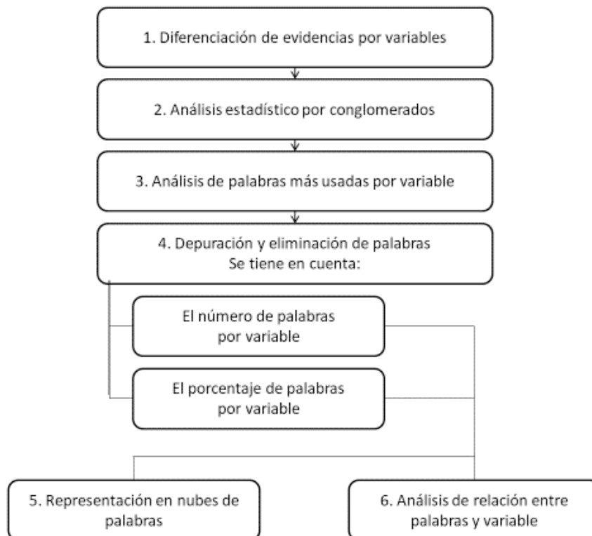
Imagen 1. Esquema del procedimiento y análisis

Tras la depuración de la base de palabras, se procedió a realizar un recuento de las más utilizadas para analizar las palabras que se relacionaban con cada una de las variables, y se calculó qué porcentaje del total representan, poniendo de manifiesto (como se indica en el apartado 5. Resultados), que los conceptos predominantemente guardaban relación con la pedagogía. Con estos datos es posible representar la información de interés en nubes de palabras que la expresan gráficamente (Paso 5; Imagen 1). Este conjunto con las palabras más frecuentes ha permitido realizar un análisis relacional (Paso 6; Imagen 1) entre la palabra protagonista de nuestra investigación: «niñas» y las palabras más frecuentes en cada variable, así como con la propia variable, para poder tener un panorama de los conceptos que guardaban relación con esa feminidad.