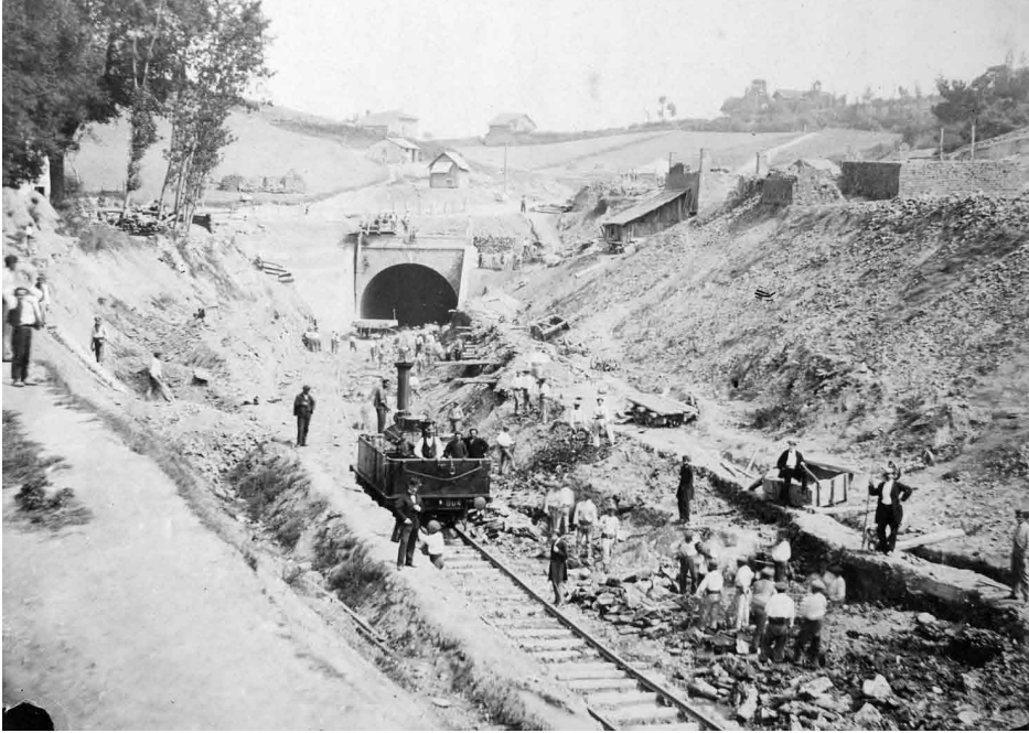
Obras de construcción del ferrocarril del Norte en Zumárraga. Año 1863.