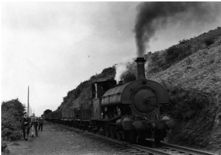
Tren minero de The Orconera Iron Ore (Bizkaia). El papel del ferrocarril fue esencial para el desarrollo de la minería y la industria en Vasconia.

construcción se realizó con gran celeridad, lo que permitió inaugurar el servicio a partir del 3 de enero de 1873, el estallido de la Segunda Guerra Carlista, con especial actividad en la zona servida por el ferrocarril, supuso la paralización de la explotación. Posteriormente, problemas de diversa índole retrasaron su nueva puesta en marcha hasta la tardía fecha del 18 de enero de 1887 85 .