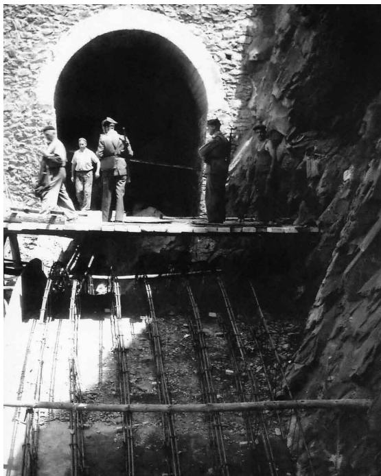
Obras de construcción del ferrocarril de Sukarrieta a Bermeo. Una pareja de la Guardia Civil vigila a los presos utilizados como mano de obra esclava por la empresa Banús Hermanos.