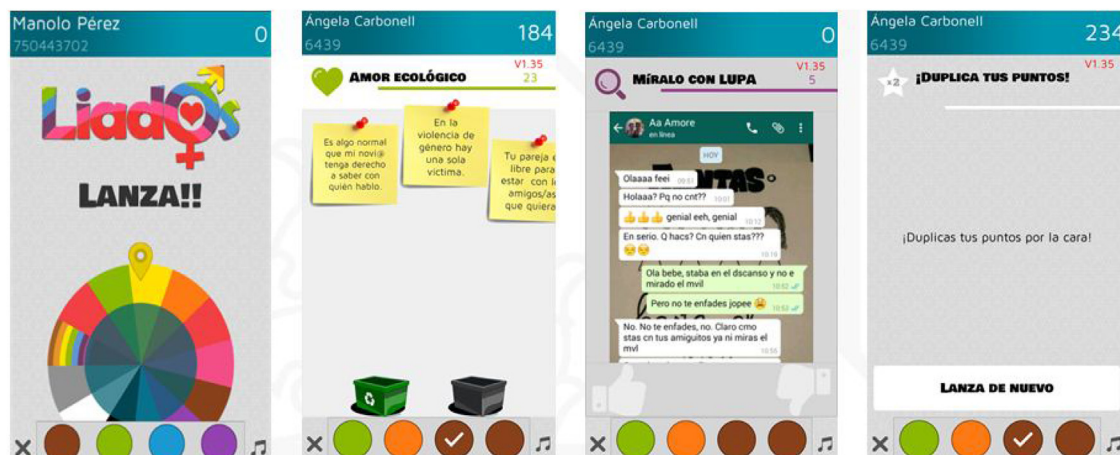
Figura 1. Imágenes de funcionamiento de la app Liad@s a través de varias pruebas.

En el grupo experimental, al finalizar la intervención se administran de nuevo los cuestionarios para verificar la eficacia de la misma.